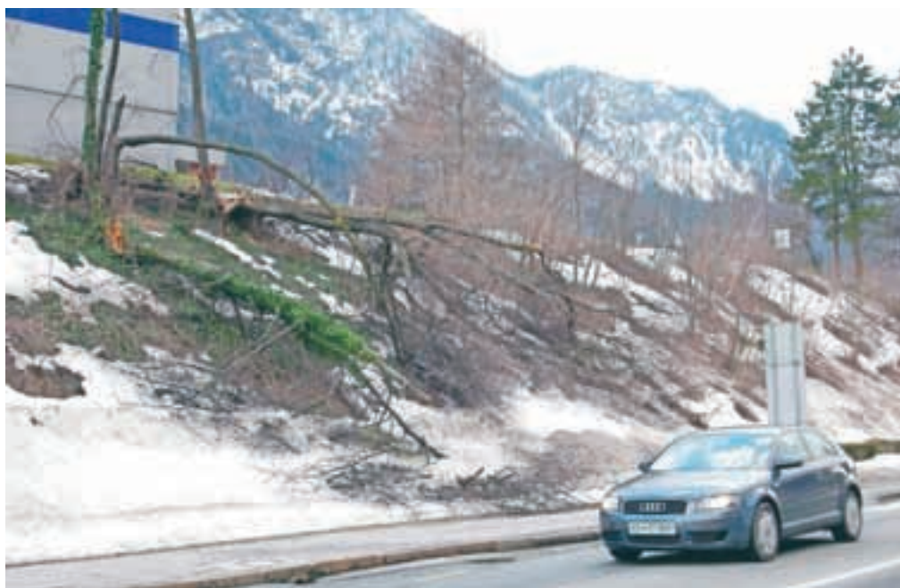
Snegolom in žled sta na Jesenicah povzročila veliko škode tako na javnih kot na zasebnih površinah.

Žledolom in snegolom sta v začetku februarja uničevala drevje, parke in okrasno drevje tudi v jeseniški občini. Občina Jesenice je prek javnega komunalnega podjetja Jeko-In in ob pomoči zunanjih izvajalcev takoj začela s 1. fazo odstranitve dreves in vej na javnih površinah. V prvi fazi so interventno odstranjevali poškodovano drevje in veje brez odločbe, in sicer glede na stopnjo nujnosti, zaradi odprave nevarnosti za ljudi, premočnin ali nepremočnin. Pred 2. fazo, ki se bo začela ta mesec, si bo stanje po posameznih krajevnih skupnostih ogledala komisija za posek, obrez in novo zasaditev dreves, skupaj s predstavniki iz krajevnih skupnosti. Na podlagi tega oglada se bo zapisal zapisnik in nato izdala odločba, ki bo osnova za odstranitev in obrez dreves v 2. fazi, izdana pa bo izvajalcem za posamezne teritorije. Za drevesa, ki se bodo obrezovala, bo izva-