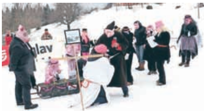
Zmagovalna skupinska maska – Pogreb smučarskega doma Črni vrh