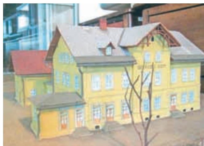
Maketa Delavskega doma Pri jelenu na stalni razstavi v Kosovi graščini

Z rušitvijo stavbe, ki je svojo bitko s časom izgubila že nekaj desetletij prej, na Jesenicah izgubljam še enega od delavskih simbolov polpretekle zgodovine. Spomin na imenitni Delavski dom Pri jelenu na Savi, katerega pomen je daleč presegal občinske meje, bo tako verjetno ostal le na spominski plošči, ki na pročelju doma spominja na dvainpetdeset padlih v drugi svetovni vojni, in v obliki makete (v razmerju 1:100) na stalni razstavi novejšje zgodovine v prvem nadstropju Kosove graščine. (se nadaljuje)