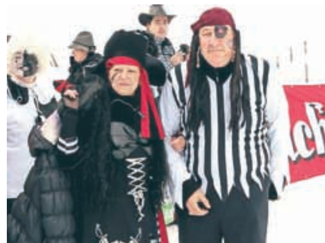
Zmagovalca med pari – Pirata s Karibov