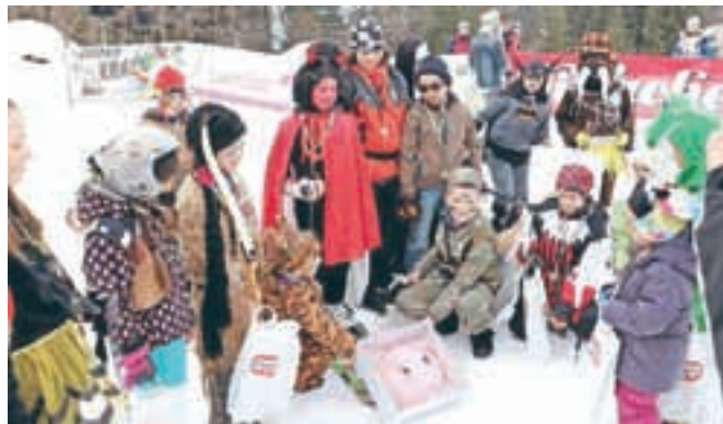
Sladko svinjsko glavo v obliki torte so si otroci razdelili in z veseljem pojedli.