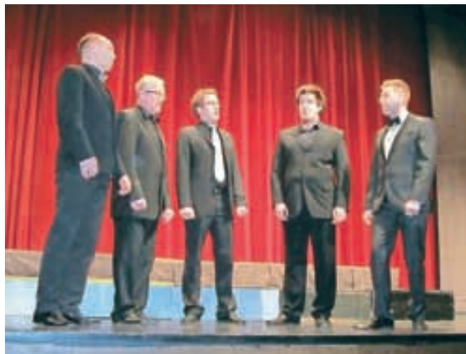
Kvintet kulturnega društva Vintgar

Pompe, o nastopih pevk in pevcev pa je dejala: "Eni zbori so ambiciozni, pri drugih je namen le druženje ob petju, vendar pa imajo vsi neko pozitivno energijo, ki jo želijo prenesti med poslušalce. Napredek je, vsak zbor je skušal doseči še več, nadgraditi tisto, kar smo se pogovarjali lani. Veliko mladih pevcev je, predvsem v moških zasedbah zborov Vox Carniolus, kar je zelo spodbudno. Nasvet za vse je: pojte ubrano in se veselite možnosti, da svoj talent podajate drugim ljudem."