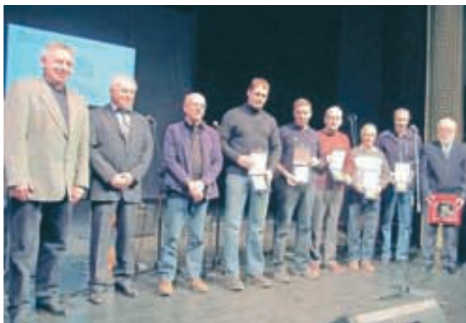
Podelili so tudi zlate, srebrne in bronaste plakete ter priznanja Športne zveze Jesenice