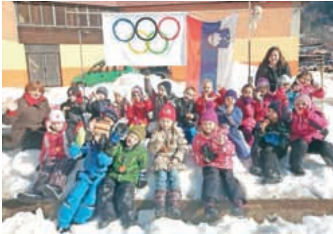
Otroci so preživeli lep dan na snegu v olimpijskem duhu.