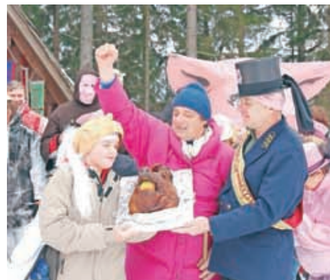
Glavno nagrado – pečeno svinjsko glavo za najbolj srednji čas – sta odnesla domačina v maski veganka in stari dedec.