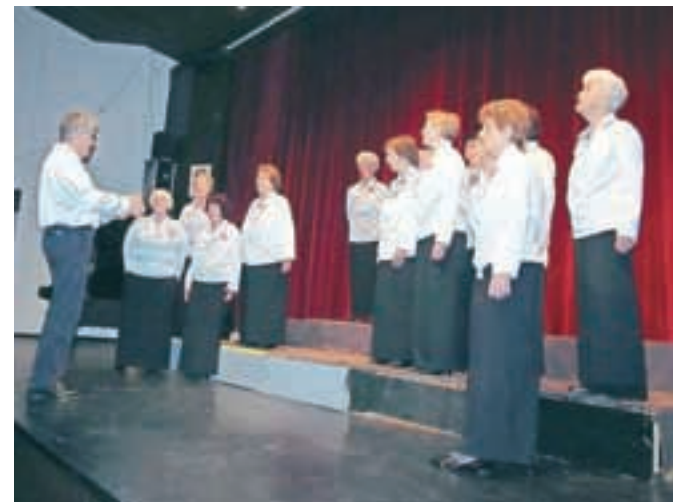
Ženski pevski zbor Društva upokojencev Jesenice