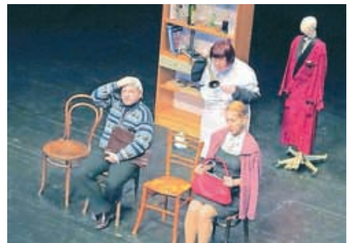
Nastopili so tudi profesorji z zasedbo Teater, prof. in ljudsko igro Dr. Vsezna in njegov sluga Štipko Tiček. Nastop si je ogledal tudi selektor za Linhartovo srečanje.